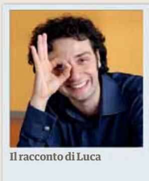
Il racconto di Luca